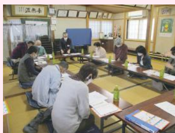
防災出前講座の様子

「防災出前講座」の開催により、自然災害への備えや、避難の際の感染症対策を学んでもらうことで、地域防災力の向上を図ります。また、地域と小学生による「地域安全マップづくり」を支援し、子どもの防犯力向上を図るほか、防災・防犯・交通安全の各分野のパネル展示による啓発を行います。