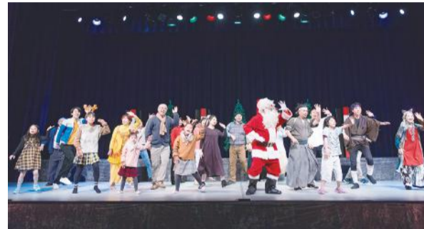
◀令和2年度公演の様子

日 時 12月4日(土)、5日(日) 場 所 東区プラザ 内 容 東区プラザ開館10周年記念公演