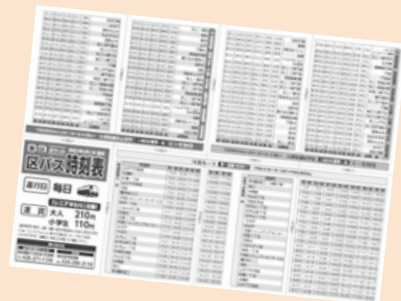
▲(左)区バス運行ガイド(A4サイズ) (右)ポケット時刻表(仕上がりA7サイズ) 区役所地域課(43番窓口)や区バス車内、区内公共施設などに設置しています