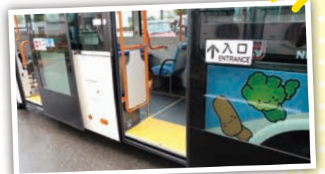
新しい車両の乗降口