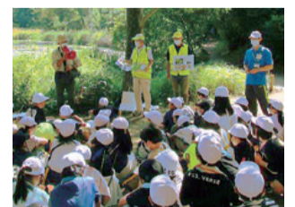
▲じゅんさい池で地域の人から説明を聞く様子

令和3年度には、タブレット端末を使って、調べたことをクイズ形式でスライドに表現し、保護者や地域の人へ発表しました。