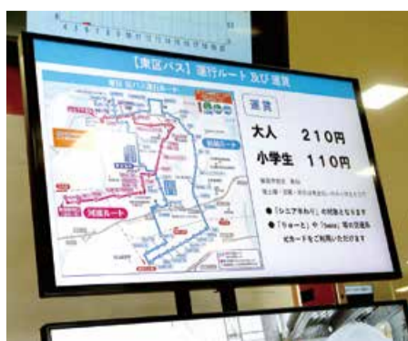
▲大型モニターによる表示(土日・祝日を除く)