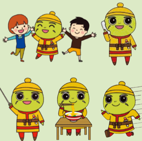
ぬたりん×寺山公園