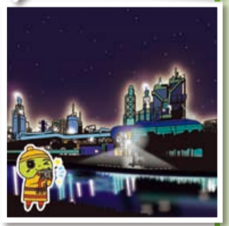
ぬたりん×東区工場夜景