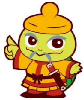
浄足柵マスコットキャラクター ぬたりん

平成29年12月利用分から、東区プラザの利用許可申請等がインターネットからもできるようになります。これに伴い、 これまでの窓口、電話・FAXによる予約はインターネットでの抽選後に空いている部屋のみ となります。