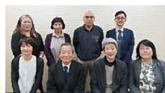
▲広報紙編集委員会