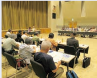
審議に取り組む様子