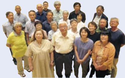
委員一丸となって頑張ります (令和6年6月27日開催の全体会議出席の委員を撮影)

令和6年4月25日、東区プラザホールにて第1回東区自治協議会を開催し、令和6年度の活動をスタートしました。区民の皆様と行政との「協働の要」として、昨年度実施した「東区民意調査」の結果を踏まえつつ、より住みやすい東区を目指して様々な活動に取り組んでいきます。