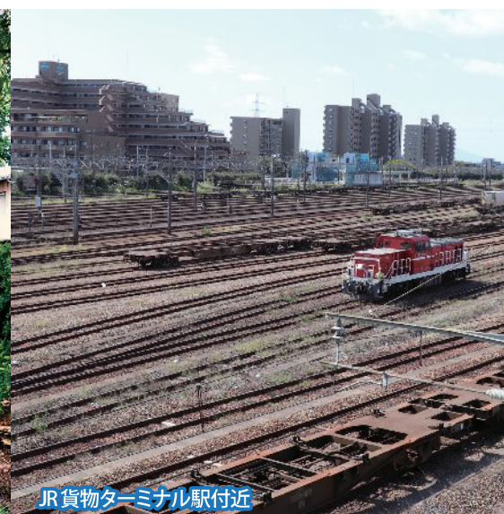
JR貨物ターミナル駅付近