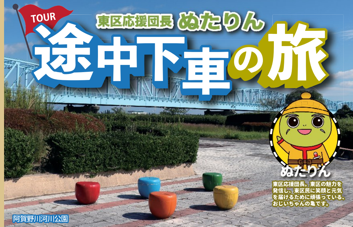
阿賀野川河川公園

東区応援団長。東区の魅力を発信し、東区民に笑顔と元気を届けるために頑張っている、おじいちゃんの亀です。