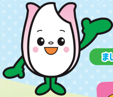
新潟市食育・花育推進キャラクター まいかちゃん