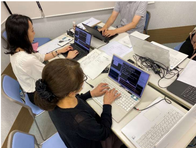
↑ パソコン要約筆記

話をそのまま文字にすると伝わりにくいため、話し手の意図をつかみ要約して伝えます。要約筆記の方法には、手書きとパソコンの2通りあります。