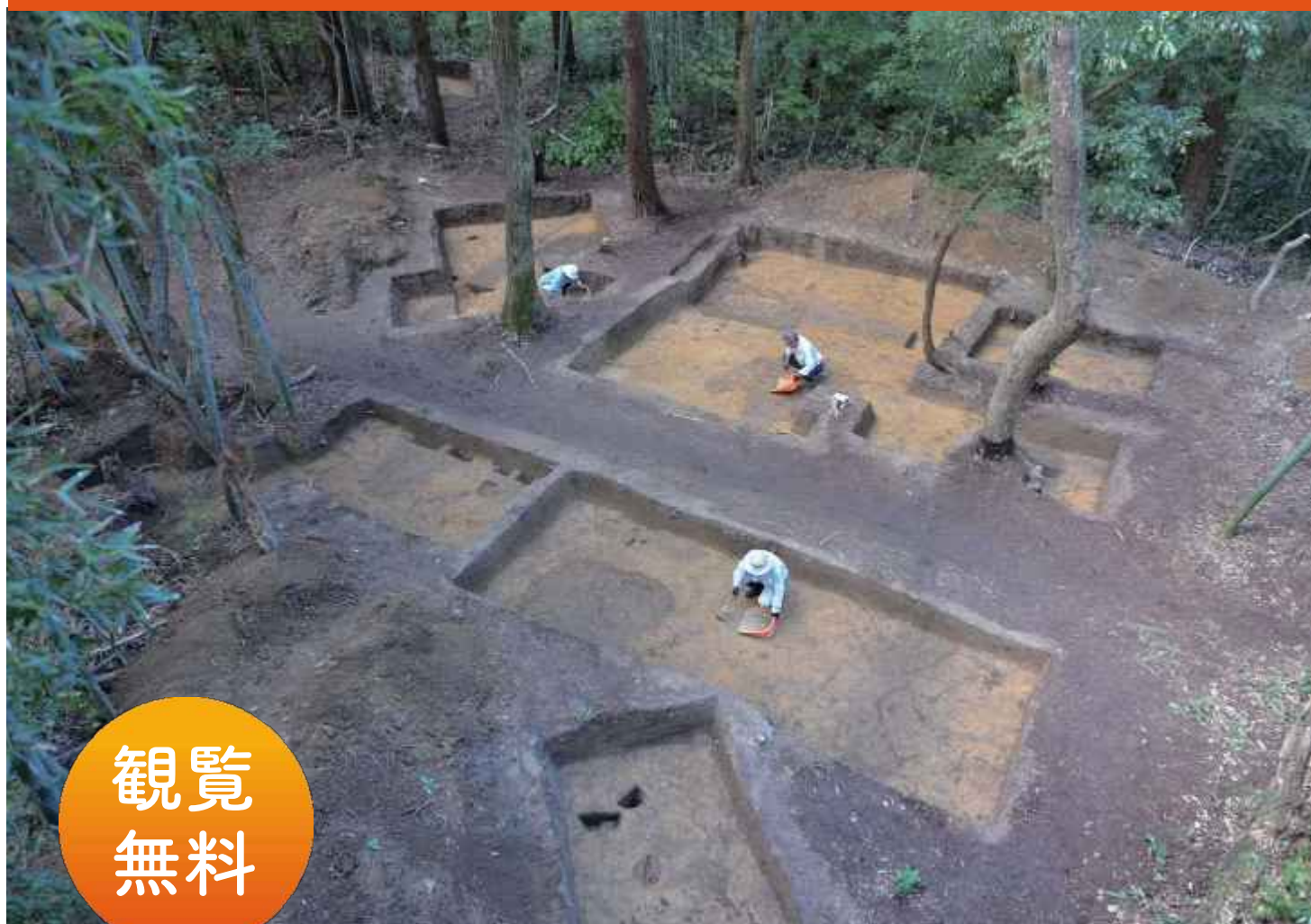
新たに発見された方形周溝墓(SZ743)調査風景