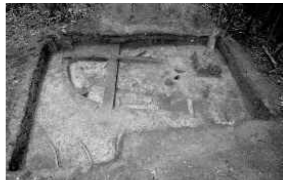
新たに発見された竪穴住居(SI728)