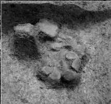
遺物出土状況(方形周溝墓周溝内)