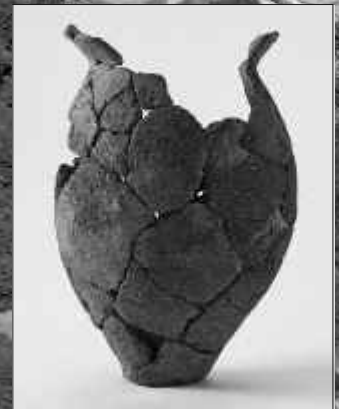
方形周溝墓出土の弥生土器