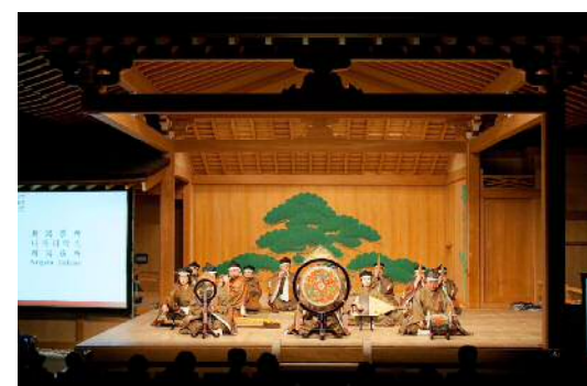
新潟市の芸能として新潟楽所が厳かな雅楽を披露した