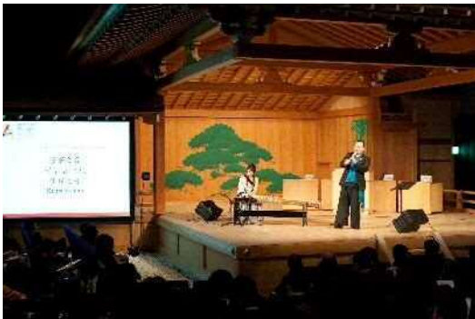
開場前には「薫風之音」の琴と尺八の音色がお出迎え

最後に市内の学生や留学生、また、当日の来場者から未来へのメッセージボードを書いてもらい、その写真をスライドショーで放映しました。