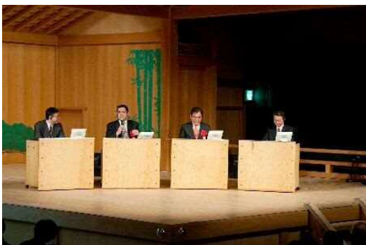
3都市代表による熱のこもったパネルディスカッション