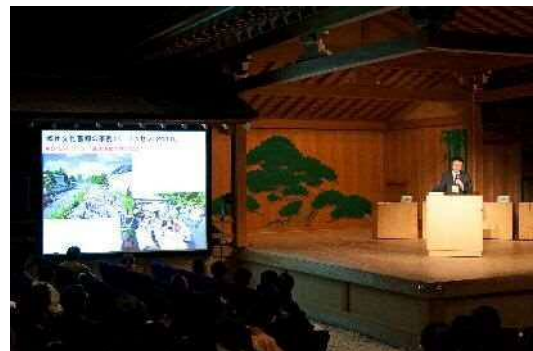
太下氏の基調講演では事業の意義や効果が語られた