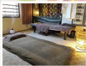
※通常ベッドですが、赤ちゃん連れの場合、 床にお布団を敷いてそこに寝て行きます。