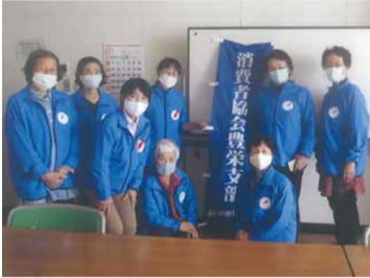
同支部役員のみなさん

消費者協会とは、安心安全な消費生活を求め活動する消費者団体です。 同支部では、「安心安全で環境にやさしい暮らし」を目指し、さまざまな活動をしています。イベントでの出店やPR、視察研修や講演会の開催など、それぞれの会員が得意なことを活かし、地域とのつながりを大切にしながら活動しています。