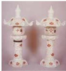
あかえほなびしからくさもん 赤絵花菱唐草文灯籠

日 4月13日(日)午後0時半～4時半 内 北区各地の県・市指定と国登録文化財を見学後、同展の解説 見学する文化財(10件) あかえほなびしからくさもん 大久保の大ケヤキ、赤絵花菱唐草文灯籠など 内先着20人 参加費(バス代金と同館の観覧料込み) 一般400円、大学・高校生270円、中学生以下140円 申 3月22日(土)午前9時から窓口、電話で同館