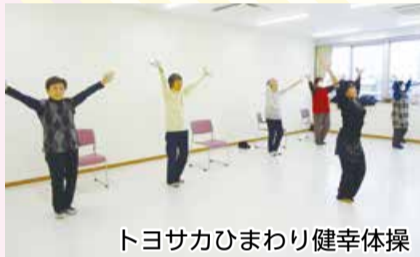
トヨサカひまわり健幸体操