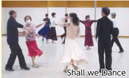
Shall we Dance