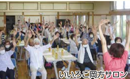
いろいろ岡方サロン