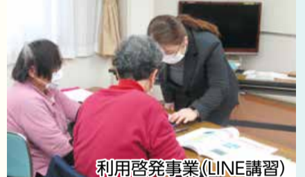
利用啓発事業(LINE講習)