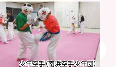
少年空手(南浜空手少年団)