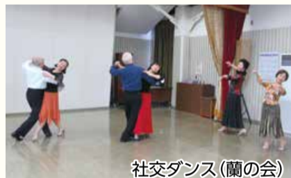
社交ダンス(蘭の会)