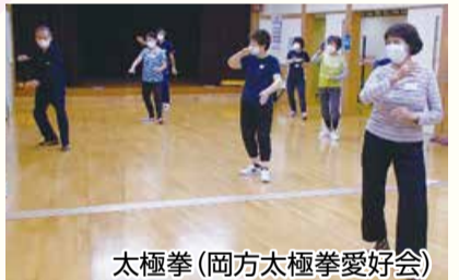
太極拳(岡方太極拳愛好会)