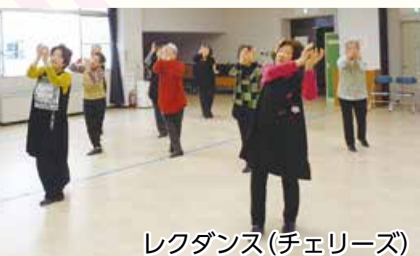
レクダンス(チェリーズ)