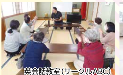
英会話教室(サークルABC)