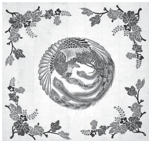
白縮緬に藍染めの敷物