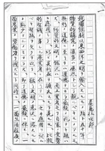
真嶋桂次郎の自筆原稿