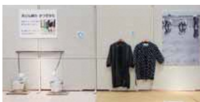
天秤棒・野良着体験スペース

令和4年度は、氷冷蔵庫・釜・洗濯板・炭火アイロンなどを展示し、電気・ガス・水道や工業製品が少ない頃の生活を紹介しました。あわせて、水道が無い頃に行っていた天秤棒を担いで水を運ぶ体験と野良着の試着体験ができるスペースも設けました。