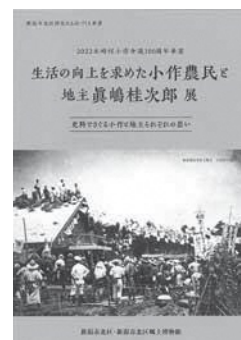
企画展パンフレット