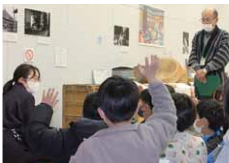
小学校3年生の学習のようす

昔の農具などを展示している常設展示室では、昔の米作りの話などを通して、この地域の昔のようすや米収穫後のワラを利用して道具を作った先人の知恵と工夫、物を大切に地球にやさしい昔のくらしについても学習できます。