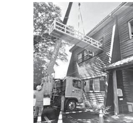
ハンリョウブネの梱包作業（写真上）と 搬出作業（写真左）