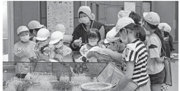
濁川小学校の展示見学(7/15)