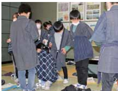
野良着の試着体験のようす