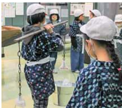
天秤棒で水運び体験のようす

子どもたちは実物の昔の道具を見て体験して、先生方の授業に加え、実際に昔の道具を使ったことがある市民ガイド(ボランティアガイド)の経験談や学芸員の説明などを通して、現代との違いに興味を持ち、理解を深めていました。