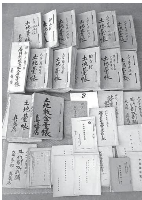
真嶋家旧蔵文書類