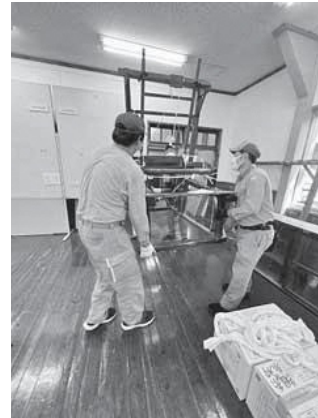
手織り機の搬出作業