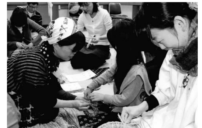
第24回 博物館まつり なべしき作り