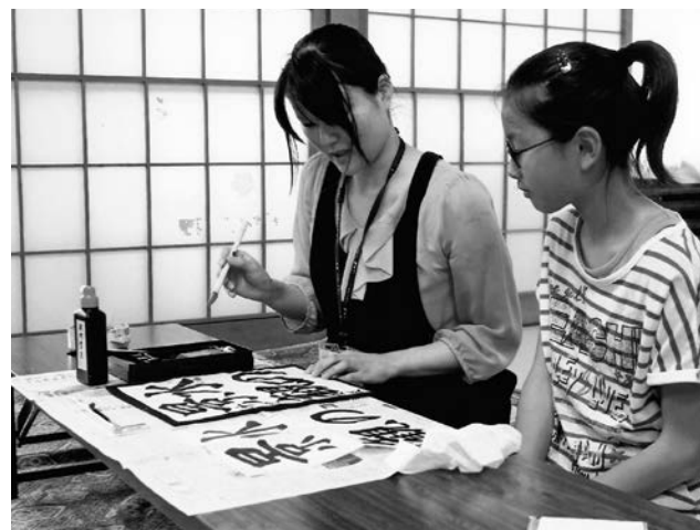
松蔭賞書道展 課題練習会