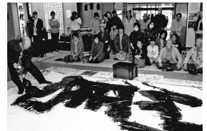
第24回 博物館まつり 超大筆パフォーマンス