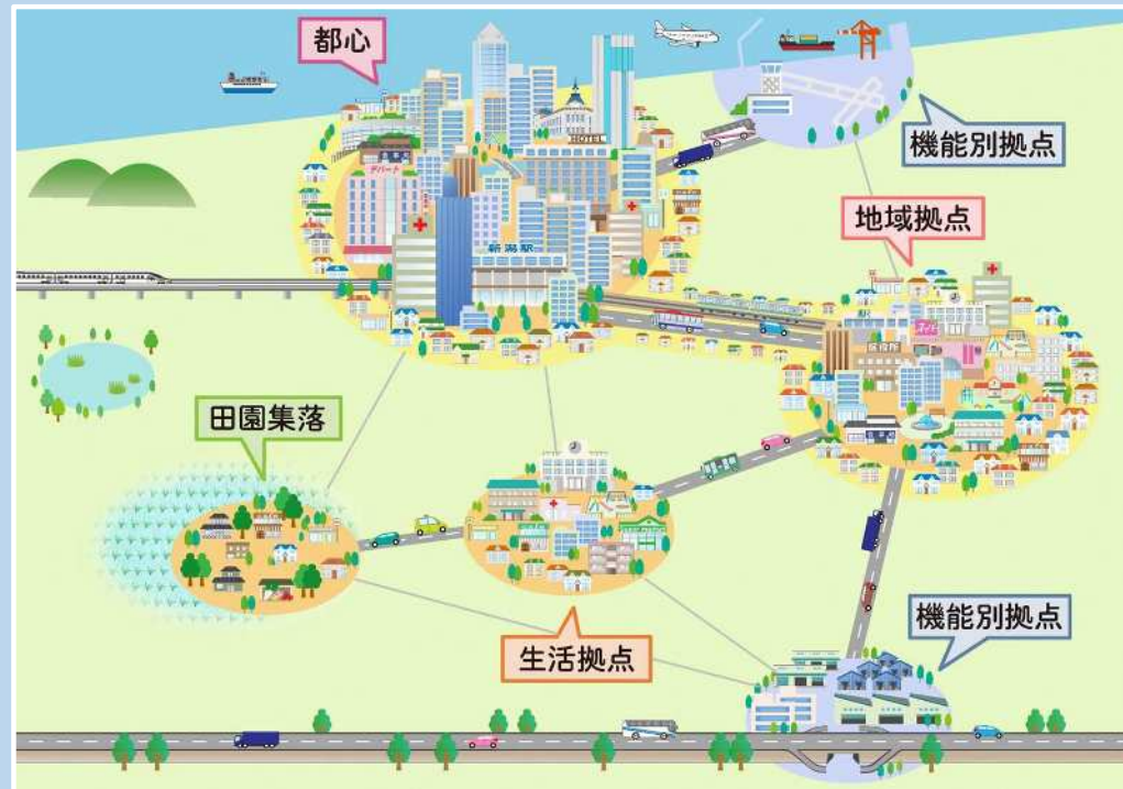
図 拠点とネットワークによる都市構造イメージ