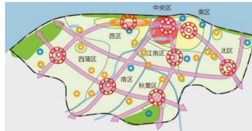
図 都市構造の全体イメージ