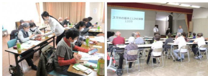
早通地域コミュニティ協議会 福祉部会

講師の方からは、わかりやすく丁寧に、また楽しく教えていただき、あっという間に時間が過ぎました。来年度も開催いたしますので、関心のある方はぜひご参加ください。