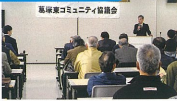
○4/6 総会 59名参加