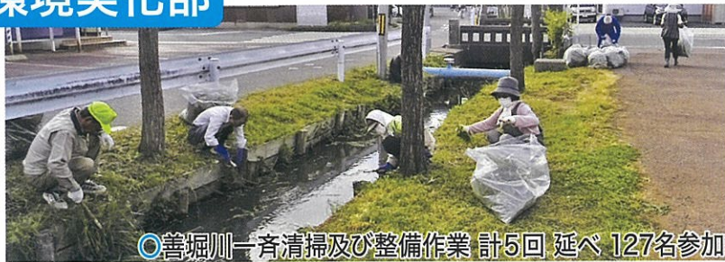
○善堀川一斉清掃及び整備作業 計5回 延べ 127名参加