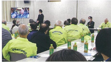
○11/20 交通安全研修会 50名参加