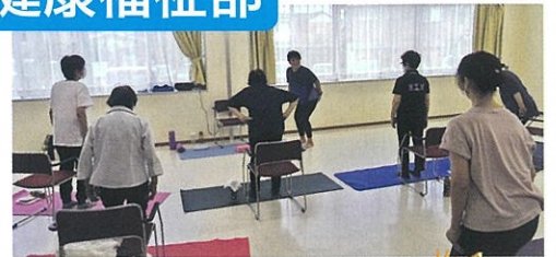
○健康体操4回 延べ74名参加 ○9月高齢者訪問161名