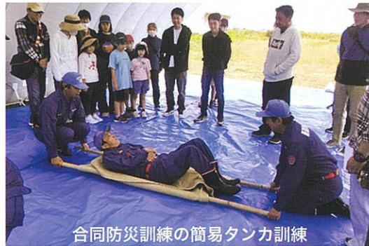
合同防災訓練の簡易タンカ訓練