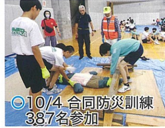
○10/4 合同防災訓練 387名参加