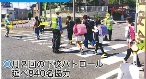
○月2回の下校パトロール 延べ840名協力