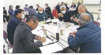
○1/25 支え合いのしくみ づくり会議41名参加