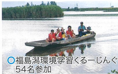
○福島潟環境学習くるーじんぐ 54名参加