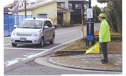
○5台での青パト巡回