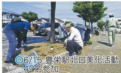
○6/15 豊栄駅北口美化活動 42名参加