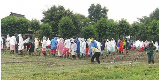
○9月福島潟自然文化祭