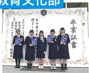
○フォトスポット設置