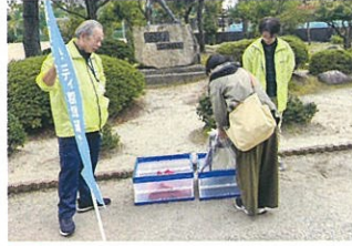
○学用品リユース事業