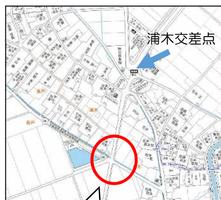
土地改良区用水池脇の交差点

以上のことから、法線決定(浦木交差点付近の改善も含め)には地域の意見を聞いた上で早期に決定するとともに、法線決定後はすみやかに着工して欲しい。また、中央環状道路の短期改善として用水池脇交差点の改良と信号機設置を早くしてほしい。