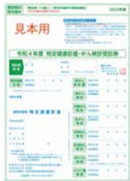
▲受診券(国保加入者用)