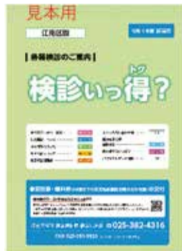
▲案内冊子「検診いっ得?」