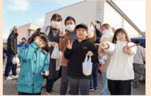
参加賞の両川産梨を持ってピース