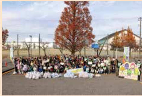
集めたゴミの前で写真撮影