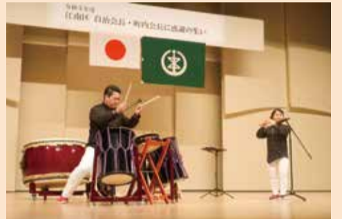
nanairo(なないろ)による演奏