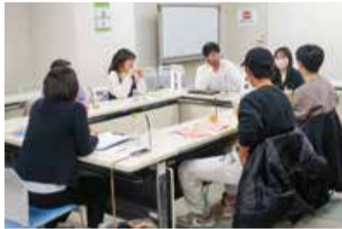
江南区にUターンした先輩のお話にくぎづけ