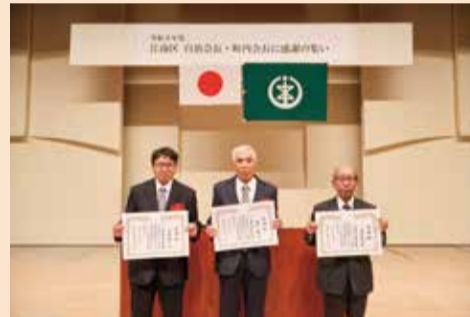
表彰された自治会長の皆様