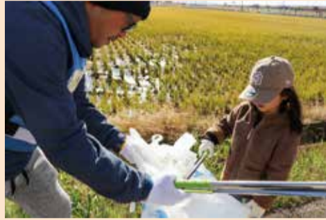
家族で協力してゴミ拾い