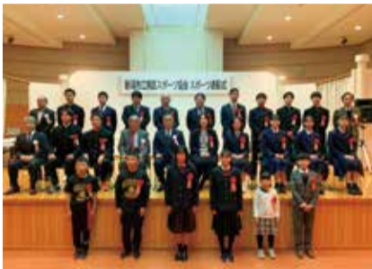
スポーツ表彰式 集合写真