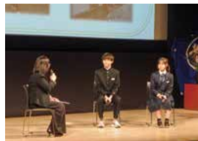
亀田西中学校生徒による報告