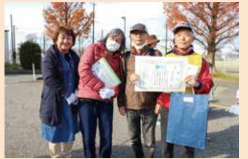
優勝おめでとうございます!