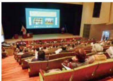
講演に熱心に耳を傾けていました