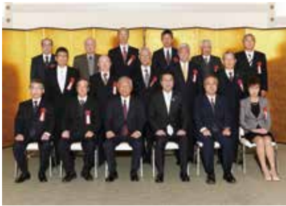
新潟市表彰式 集合写真