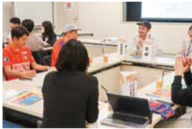
地元の魅力や進路について語り合いました

参加した学生からは、「新潟で実際に働いている人の生の声を聞いた」「年齢が近くて話しやすく楽しかった」「将来的に新潟で暮らしたいので参考になった」などの声をいただきました。