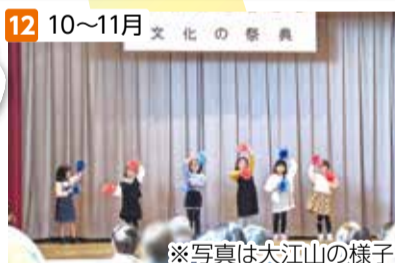
12 10~11月 文化の祭典