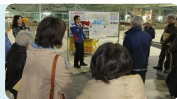
水理模型実験場の見学