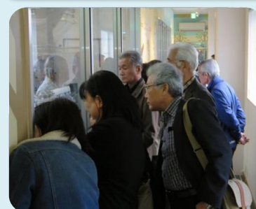
ヤスタヨーグルト工場