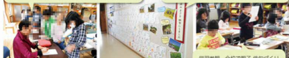
学習参観 全校で親子 俳句づくり

すてきな作品が壁いっぱい飾られ、新聞でも紹介されました。ぜひ、見に来てください!