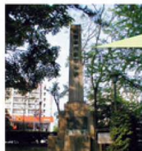
白山公園内にある明和義人の石碑。 新潟愛 (eye) Land Walking でも訪れました。

1767年、長岡藩は新潟町に1500両の御用金を課した。町民は通井藩四郎らを中心に延納の嘆願書を出すために集まったが、密告され通井藩四郎は投獄された。これに怒った新潟町の町民は一齐に蜂起し、町奉行側は藩四郎を釈放した。その後約2ヶ月、新潟町は藩四郎らを中心に自分たちの手で町政を実現した。その史実を書いた「新潟勝きぬた」（火取巻志）を元に脚本を作り演じた。