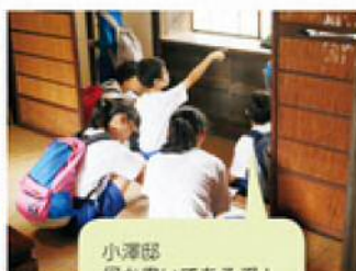
小澤邸 何か書いてあるぞ！