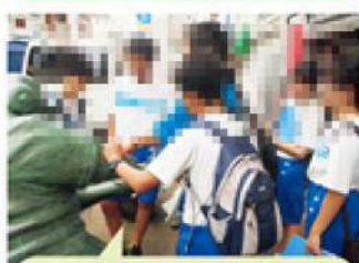
ドカベン。 ここはぜひ見てもらいたいよね！

古代の新潟市、湊町新潟の歴史、 そして現在の新潟市の町並みなどが わかりました。