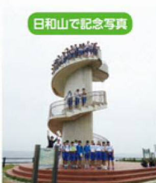
日和山で記念写真

古代の新潟市、湊町新潟の歴史、 そして現在の新潟市の町並みなどが わかりました。