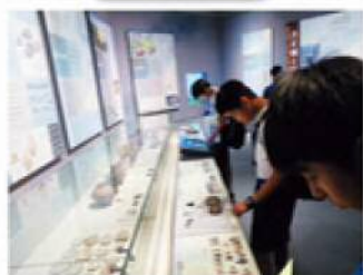
みなとびあ！ この石版、教科書に載っている！