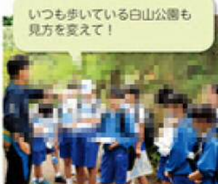
いつも歩いている白山公園も 見方を変えて！