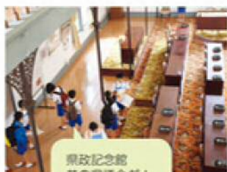
県政記念館 昔の県議会だ！