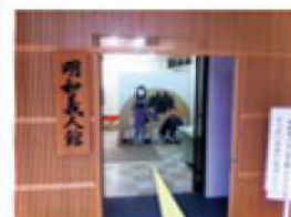
古町にある 明和義人館

白新中学校では毎年10月の文化祭で、演劇発表会も合わせて行っています。2年生のテーマは「地域素材」。今年度2年生が挑戦したのは「新潟明和騒動（明和義人）」学年全員で協力し発表しました。