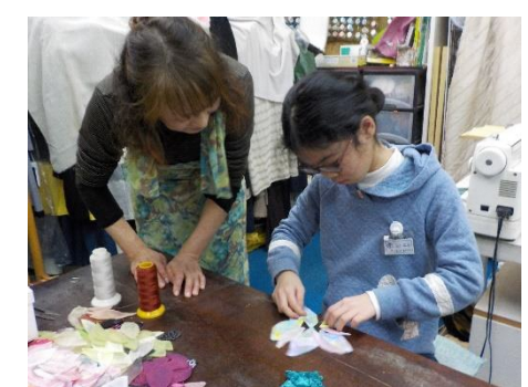
おしゃれ工房カンボスさん