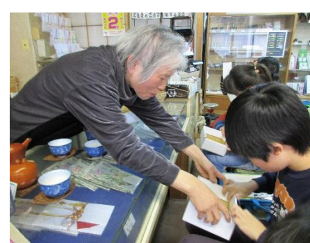
お茶の栄幸堂さん