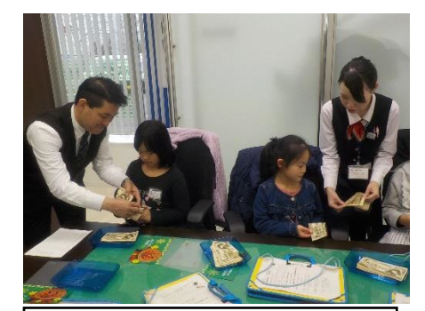
新潟信用金庫さん

<児童の感想> 私は一日店員で、「おしゃれ工房カンボス」に行きました。コースジュ作りのお手伝いをしました。はじめて作ったので、すこむずかしいところもあったけど、お店の人がやさしく教えてくれて、きれいに作れました。今度はお母さんと行きたいです。