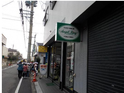
エンゼルリングさん