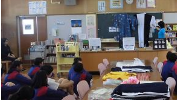
浴衣についての学習