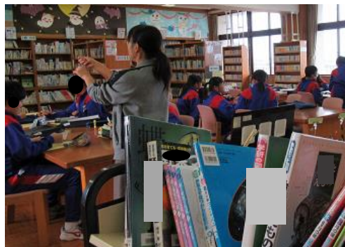
参考になる図書資料が見つかった生徒からデザイン画を作成