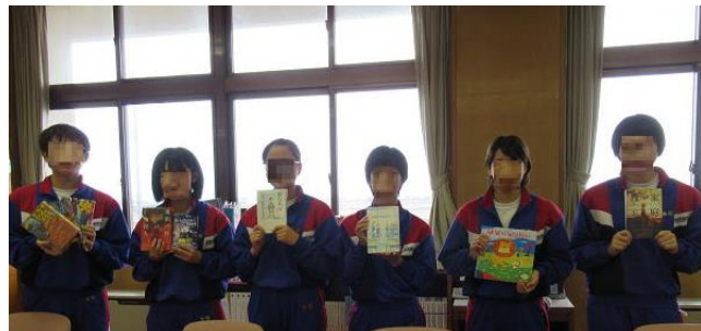
発表者の6人全員ジャンルの違う本を紹介した。 それぞれが個性を發揮し、達成感を得た。