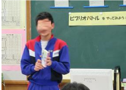
「第1回ビブリオバトル」 自分の感想を楽しく話す生徒

読書センターとして機能を充実させるための一環として、今年度「ビブリオバトル」を実施した。西川中のほとんどの生徒が「ビブリオバトル」を認識していなかったため、まずは図書委員全員で学ぶことから始め、その後委員会内で1回目を実践した。