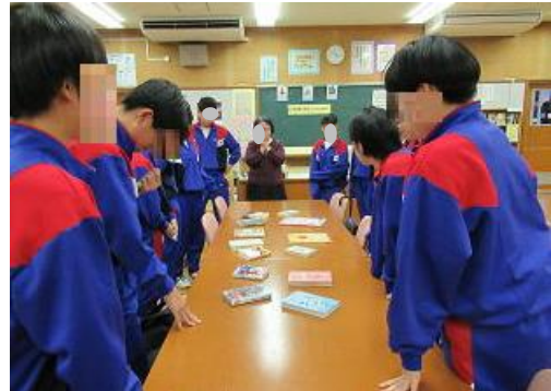
チャンプ本を決める時が一番の盛り上がり

図書委員会の生徒が楽しんでいる様子も見受けられ、「チャンプ本」者になれなかった生徒からは「もう一度やりたい」「リベンジしたい」などの建設的な意見がでた。