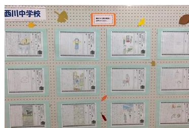
新潟市立西川図書館に展示