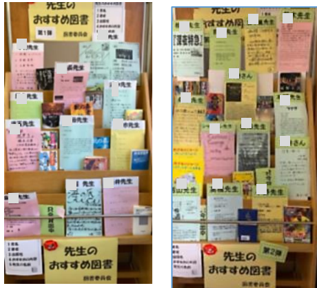
第1弾・第2弾「先生のおすすめ図書」 図書館に本と一緒に展示