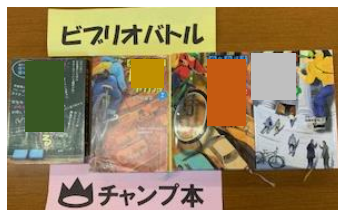
第1回・2回チャンプ本