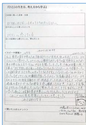
新聞記事を題材にスピーチ原稿を作成