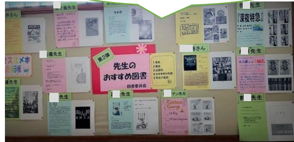
第2弾「先生のおすすめ図書」は図書館に来ない生徒が興味をもってくれるように廊下にも掲示。 図書館だよりでも紹介。