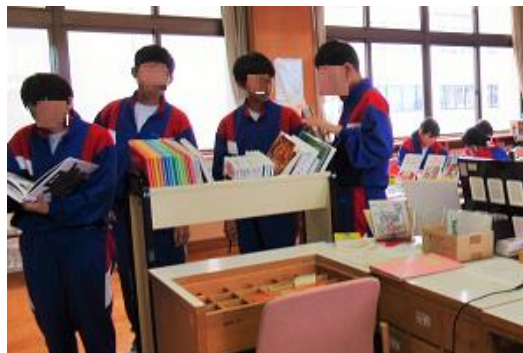
星座・季節・行事・動植物の図鑑や絵本などを抽出し事前に用意