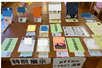
おすすめの「うちどく」の本を自校に展示

新潟市立図書館作成の「うちどくシート」を活用し、夏休み中の読書に取り組んだ。夏休み前特別貸出期間中「おすすめのうちどく図書」をブックリストと一緒に図書館に展示し、貸出を促した。夏休み後に「うちどくシート」を提出、クラス代表の生徒のシートは新潟市立図書館に展示された。