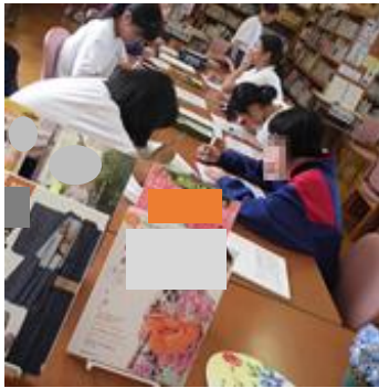
市立図書館の図書資料を活用し展示