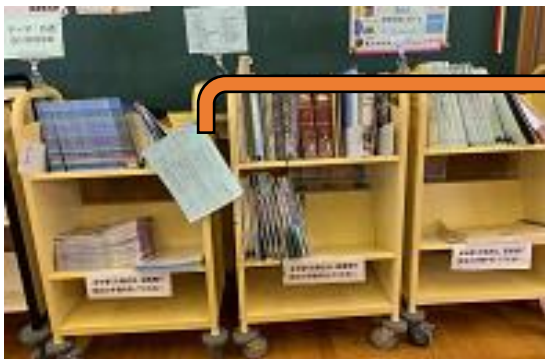
総合学習は図書館以外の場所でも行うため移動対応を取っている。