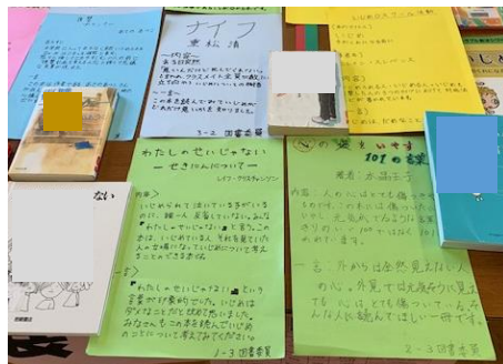
図書委員が書いた紹介文を添えて本を展示