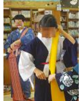
浴衣の着つけに挑戦