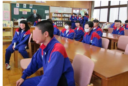
発表を楽しそうに聞いている生徒