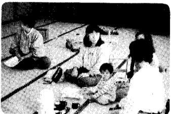
12日 サークルあすなろつ子広場開級式 おめさんとこの子カゼひかねえ。 わあとこの子じょうぶであえ。