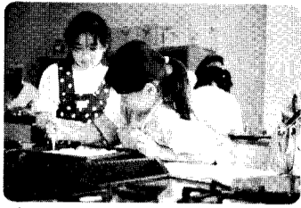
8日 子どもクッキング教室 料理つてむずかしいね。 早くたべたい。