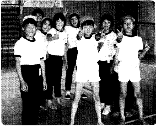
たくましく育つ体験のできない環境におかれていると言われる子どもたち。快適さ、便利さに馴らされすぎていられるのでしょうか。家庭や地域社会を作っている私たちに何が求められているのでしょうか。