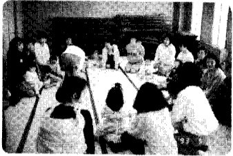
11日 サークルつくしんぼ開級式 みなさんよろしくおねがいしますねえ