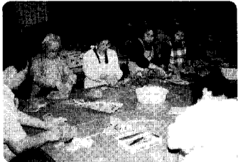
21日 夜間陶芸教室開級 昨年に引き続きの陶芸教室です。夜の勉強は大変ですが、がんばりましょう。