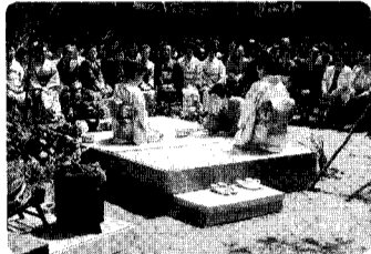
27日 町民茶会 町内・町外から大勢の方が参加されました。