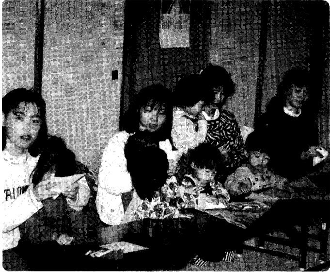
お母さん! これどうするの?

中央公民館では、毎年乳児を持つお母さん並びに幼児を持つお母さんを対象に「家庭教育学級」を開設しています。親子のコミュニケーションを図りながら、ふれあいの場づくりを併せて仲間づくりを目指しています。