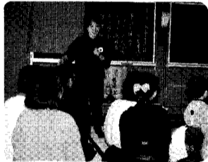
専門の先生を迎えてのお話。(家庭で起きた事故の応急手当について)

私は今年の四月より医療器具販売会社に勤務しております。業務上、数多くの福祉施設を視察して参りました。そこで今問題となっているのが、介護者の負担の大ききであります。腰痛を始めとした多くの身体的故障が出ております。こういった