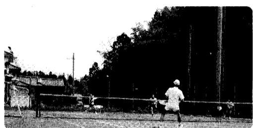
“絶好のテニス日和に恵まれました。”