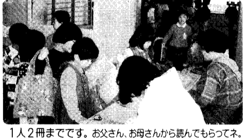
1人2冊までです。お父さん、お母さんから読んでもらってネ。

楽しみを味わってください。みんな、本をドンドン借りて読んでくださいネ。 公民館では、みんなのために本をいっぱい揃えていく予定です。