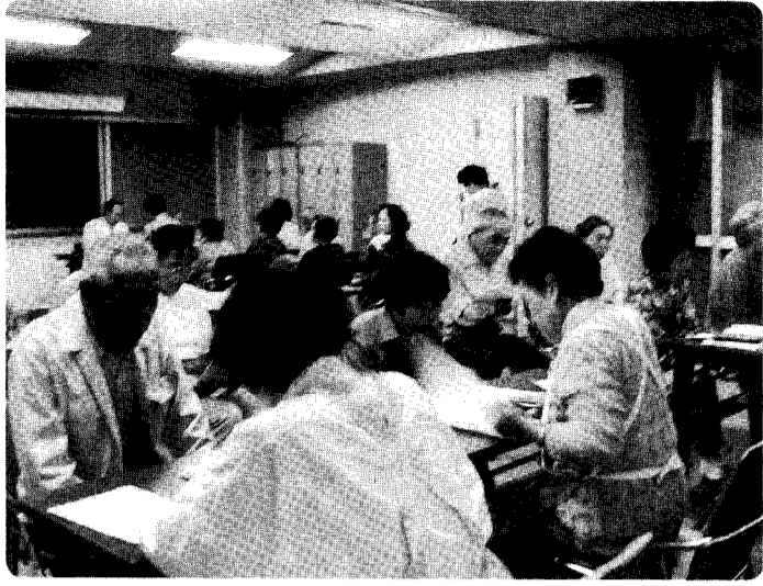
“あなたは健康維持のためどんなことに注意していますか?”