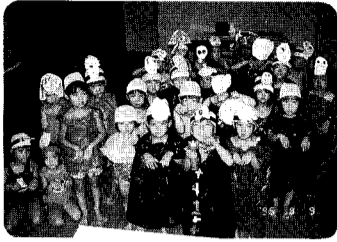
9日 小須戸保育園 おはけ大会「ウラメシヤー、どう? 恐いでしょ。」