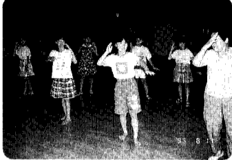
11日 民謡流しの練習に励む子供たち「はい、手を伸ばして、こうですよ。」