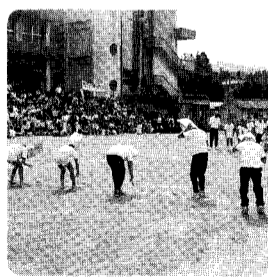
スポーツ大会結果

洗いにくいペンの中は卵のカラーで狭い口のペンの中は、よこれても洗いにくいものです。卵を細かく砕いてペンの中に入れて小瓶の水と一緒によく振ると、きれいになります。