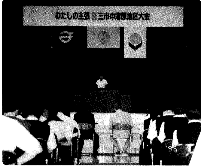
大勢の前でも堂々と発表してくれました。一横越村総合体育館

みなさんは「身体障害者専用トイレ」を見たことがありますか。私はこの前初めて、横越中学校で見て「なんて珍しいんだろ」と思いました。そして、友人に話してみたら、「私たちの学校にもあるよ」と言われ驚きました。こんなに身近にあったのに、私は気付かなかったのです。そこで、自分の目で確かめに行きました。ところが、ここ数年使用していなかったためペーパーホルダーのところが少し壊れていてとても残念に思いました。一日も早く直す必要があると思います。