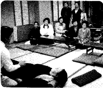
9日 「おもしろ雑学講座」 寝てても出来る健康法