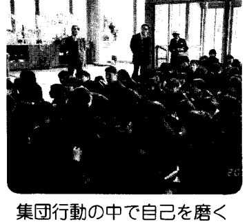
集団行動の中で自己を磨く

時には注意することにより「田の一等地」すなわち良き教育者に囲まれた環境で豊かな心を育むことができるのではないのでしょうか。私たち大人、親、教師が子供たちに暖かい心をもつ人間に成長してもらいたいという願望の証として、愛情と熱意と、時にはきびしさをもつて裸でぶつかる勇気をもつ必要があると思います。