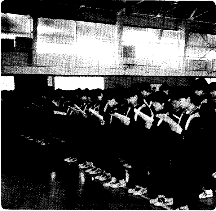
一人一人の心をつなげて学校生活を送る