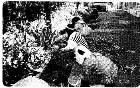
天理教草取り作業奉仕