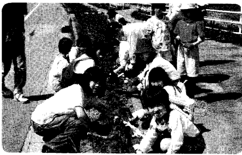
スポ少花植えボランテイヤ

◎五月十八日の快晴の中、スポーツ少年団の関係者一三六名により、花植えボランテイヤが行われました。 ウデコキの梅の木ボンブ場までつながる約一キロメートルもの歩道にある花壇にすき間なく、赤いサルビアを植えていただきました。 今後は、恒例の行事になるように、毎年取り組んでもらいたいです。