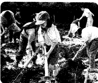
10日 「親子チャレンジ教室」 フラフラになりながらも畑づくりに熱中