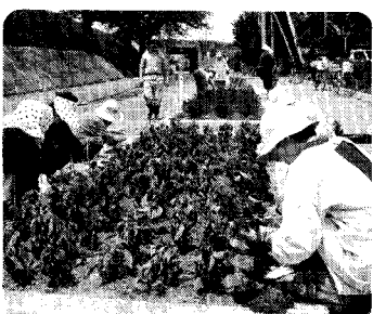
10日 「花いっぱい教室」 野外実習で町に潤いを……

◎今年もまた、天理教ゆめもとと会小須戸地区の方々(四十名)から、草取りの勤労奉仕をしていただきました。 当日は、役場と公民館周辺を、長時間に渡る手際よい作業で、見違えるほどサツパリとした庭に変身させてもらいました。 この奉仕活動は二十年以上も続いているということです。本当に頭が下がる思いです。