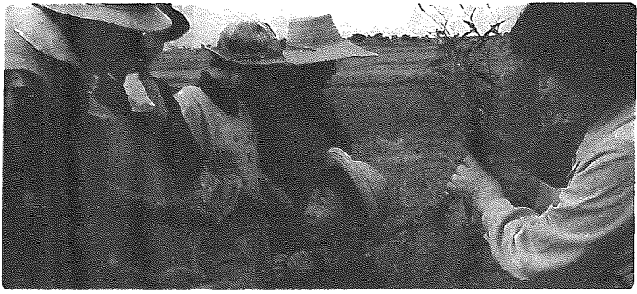
草花で対話もはずむ...

発行 小須戸町中央公民館 〒956-0101 新潟県中蒲原郡小須戸町 大字小須戸117番地 TEL (0250) 38-2234 FAX (0250) 38-3041 編集 公民館報編集委員会