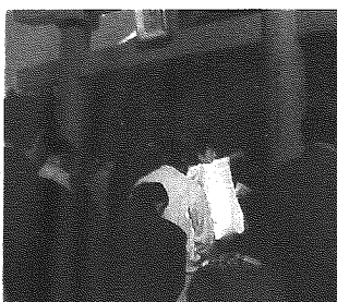
晩冬の境内に祝詞がひびく

◆午前十一時、神事開催の太鼓が鳴り渡り、神主さんの祝詞が寒風をこらえて響き渡る。高ヶ沢部落(矢代田第一常会)の人全員がローソクを奉納し、稲荷神社の前に集合している。