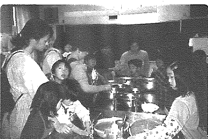
どんげえ、模様になるろっか? (草木染め)