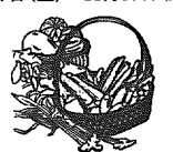
旬の野菜で家族の健康を支える食生活

季節にあった調和のとれた食事で健康的な食生活を送りましょう。日時 5月21日(土)・7月16日(土)・9月17日(土)・11月19日(土) 午前10時～12時(全4回) 会場 中央公民館(2階・調理室) 対象 一般(定員16名) 持ち物 エプロン、三角巾、タッパ、ふきん 参加費 1,500円(全4回分の食材費) アドバイザー 小須戸地区食推会・おふくろの味を楽しむ会 申込み 4月末日までに公民館へ