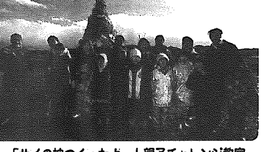
「サイの神つくだよ〜」親子チャレンジ教室 (横川浜地内)

ぜひ、おいでください。日時 三月二十日(日)午前10時～ 会場 小須戸中学校(体育館) 曲目・君の瞳に恋してる ・カルメン・ふるさと など 出演 小須戸中学校 吹奏楽部 主催 小須戸中学校