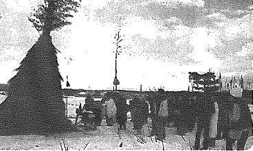
年々定着している新保第1のサイの神