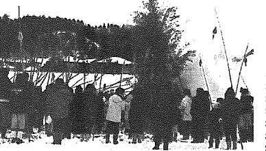
毎年、大勢の人が集まる松ヶ丘地区のサイの神