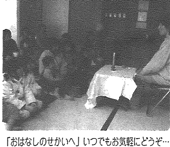
「おはなしのせかいへ」いつでもお気軽にどうぞ...

今年も公民館主催の「おはなしのせかいへ」で、たくさんの子も達から読み語りを聞いて頂き、嬉しく思います。ふれあい会館を会場にする、おばあさんとお孫さんが連れ立って、たくさん来て下さるとい特徴があります。年齢に伴って小さな字が読み辛くなった、字や絵が大きい絵本は、孫と一緒に楽しめるので、年配の方々にも良いそうです。児童書を借りる大人は図書館の「通」と言いますが、絵本はあなだけません。おばあさんと一緒にお話を聞いた子ども達は、自らの読書経験を踏まえて心豊かな毎日を送れるでしょう。なぜなら、「耳からの読書の蓄えが、目からの読書となり、読書への自立につながる」と言われるからです。子どもの読書離れを嘆く前に、耳からの読書は大人の役目。小須戸町の子も達には、耳からの読書を続けて、心の土台を築いて欲しいです。