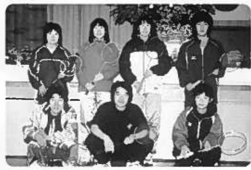
「楽しく、やろうぜ!」がモットー