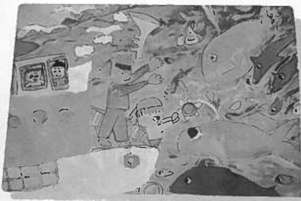
船の部分を重ねぬりしました。盛り上がるようなタイトルにしました。