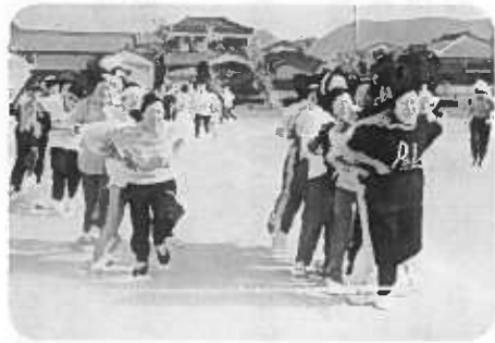
楽しみに待っている運動会(小須戸分館)

昨年度の最終第四回公民館運営審議会で、区制まであと一年の「平成十八年度小須戸地区公民館の重点目標」が次のように決まりました。 〔重点目標〕 ① 地域の一体感(まとまり)をつなぐ(つながり)を一層強くする ② ふるさと文化の継承と発展に努める ③ 特色ある事業の一層の広がり(はら)と充実を目指す 〔具体的な取り組み〕 一体感を一層強くする ① 区制後の公民館組織は、ピラミッド型の統合方式で新潟市中央公民館、区基幹公民館、地区公民館、分館となる。 ② これまで以上に、日常の活動を充実して、まとまりや、つながりが強くなるよう努める。 ③ 公民館運営審議会の役割と活動が益々大切になる。これからは更に、地域や学校への橋渡しと地域の人材発掘に、ご協力願いたい。館を持たない四分館の区制後のあり方について、しっかりと見通しをつけ、地域が一体となって活動できるようにする。 ④ 分館活動は、十七年度の事業をより充実拡大するよう全力で取り組む ⑤ 条例上の位置づけを願