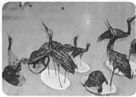
しのぶ細工講習会作品

事業の拡大と充実 ① 公民館・学校・地域の連携した子どもの健全育成 ② 小須戸地区市民展 小須戸地区芸術祭 小須戸地区文化講演会 政令市へのふるさと文化の交流と発信を進める ③ 地区館交流 文化協会めぐり ふるさと文化の有志指導者バンクの拡大 「やろてば学習」推進