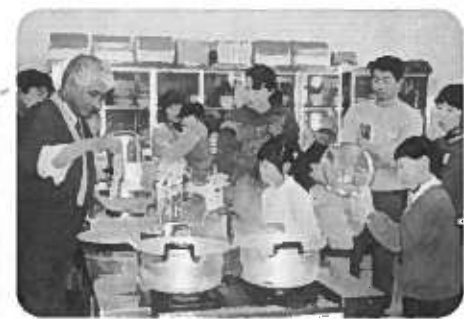
20年もつづく親子チャレンジ教室

公民館や学校施設を利用して、地域のひとと子ども達との交流を行うふれあいスクール事業(市計画) ① これまでの学校・教室の発展として ・祖父母と孫の学級 ・親子チャレンジ教室 ・おはなしのせいかいへ新設したい事業 ② 子どもスポーツ教室 ・子どもよさこい教室 ・特色三事業の発展 ③ こすど地区公民館報 地域情報の発信基地として、広く深く、足で情報収集に努める ・学校開放講座 ・新津南高校蒼丘祭(文化祭)に参加し、生徒との交流もできるようにしたい。 ④ 祖父母と孫の学級 ふれあいスクール事業として充実させたい。 ⑤ つづけて支援する事業と新設する教室