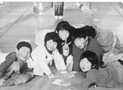
みんなで作ったカルタ。楽しいヨ!!

この時期、室内ではカルタ取りやすごろく、コマ回しなど昔ながらの遊びが人気です。中でも子ども達と一枚一枚手作りの大型カルタでは読み札を最後まで言い終わらないうちにみんな一斉に「ダッシュ」のしし年だよ、今年は一枚の札に五、六人がおおいかぶさり誰が先かで「最初はグー、ジャンケンポン」と元気のいい声が響きます。投げゴマはまだ数人しか投げられず、うまく回せない一年生に三年生の女の子がヒモを巻いてあげながら「投げる時にね、軽く引くんよ」と優しく教えてくれる姿に心が温まります。