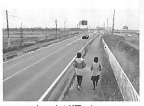
矢代田から小須戸に向かって

私は学生時代、小須戸中学校に通っていましたが、どうしてこの間(町部と山の手を結ぶ県道沿い)は一面田んぼが広がるだけで、距離が長いという印象がぬくえませんでした。帰りの時間になると、暗いし、なんとかして町並み