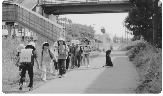
「学校おもしろかったか~」

シリーズ 「今、子どもたちは」 (141) 下校時の舟戸地区 舟戸地区防犯パトロール隊 今年も舟戸地区から多数の新入生が入学し、黄色い帽子が、登下校時勢よく波打っています。大変ほほえましい情景です。この子ども達を何人としても交通安全から守りたい一念です。 小学校低学年の父兄でパトロールに出られる人、数人で組織して、主として舟戸地区をパトロールしております。 無事黄色い帽子が玄関に元気よく入るのを見るとホッと