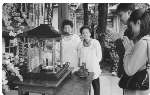
子どもの成長を願って(茂林寺の花まつり)

スポーツ大会結果 ◆第三十九回ゲートボール大会 五月二十三日(金)・親水緑地公園 ・参加10チーム・総勢85名 優勝 水田チーム 準優勝 鎌倉Aチーム 三位 天ヶ沢Bチーム 主催 小須戸地区高齢者クラブ協議会