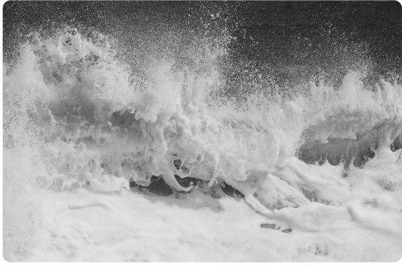
県展賞「荒波の形相」

今年四月の強風の日、新潟海岸で撮影。波の華の素なる物質を含んだ波が様々な形を変え、その一瞬を記録した。(小須戸中時代のこと) 新卒で何も出来ず生徒や保護者には頼りない教師でした。科学クラブで生徒と楽しく過ごしたことが思い出されます。(科