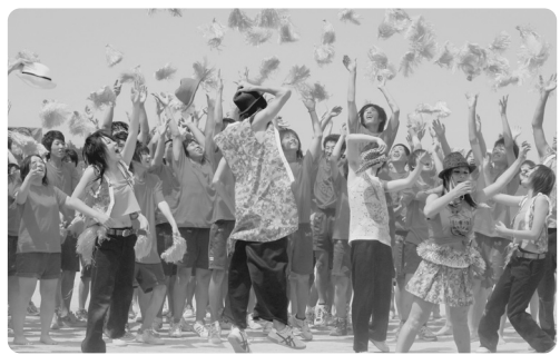
新津南高校生も元気を出してがんばっています。(6月4日体育祭の一コマ)

さて、アメリカ人はみな勇敢でそしてイギリス人はみな紳士なのでしようか。両国の方には失礼ながら、ここでは敢えて「そうでもないのだ」という見方をしてみます。まず、開拓時代のアメリカ