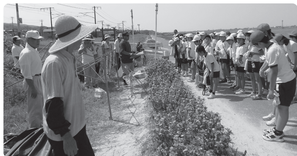
気持ちを込めて「ありがとうございました」

この写真は、九月に行われ ているマラソン大会の練習で、 児童の通行確保や見守りのボ ランティアをして頂いた皆さ んにお礼の挨拶をしていると ころです。このように、地域 住民の皆さんを筆頭に、多く のボランティアの協力が、今 の学校教育を支えています。 ボランティアの姿を見た子ど も達は、挨拶、感謝を表すこ との意味に気付き、いつか、 誰かのためにという支えの連 鎖となるのかもしれない。 新潟市教育委員会からの発 表によると、今年五月現在の 児童数は、矢代田小が29人 ですが、平成29年には184人 に、小須戸小は272人から207人 に、両校とも二割以上減少する予 想です。この少ない子ども達