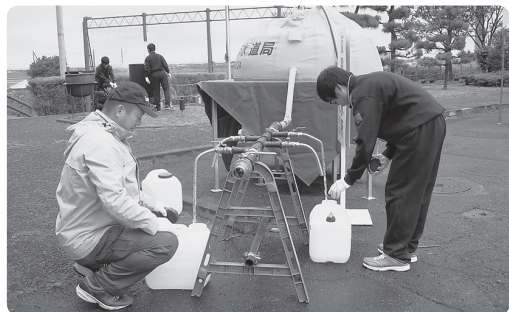
食料・物資班の給水作業

～防災は備えと意識と助け合い!!～ 10月2日(日)緊張感の中、総員約520名が参加。