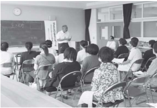
テーマは「子どもたちの「生きる力」を育てます」