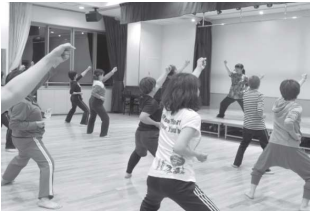
よこやぐ形になってきました