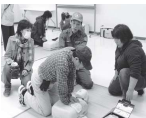
昨年のAED体験の様子

その他にも消防車と救急車の展示、秋葉区社協の協力による非常食の展示、子供たちが参加できるわなげコーナー、屋内でのましかど健康チェック