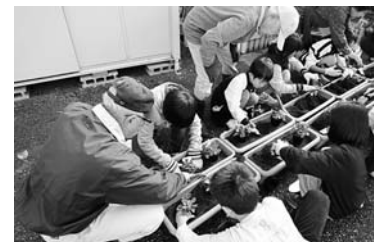
ふれあい会館前で小学生による植栽作業