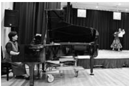
もしもピアノの会