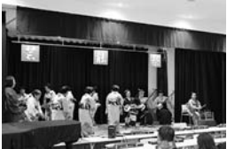
小須戸音頭甚句保存会