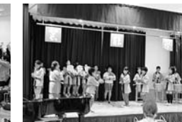
小須戸甚句子供会