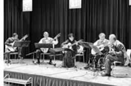
小須戸クラシックギタークラブ