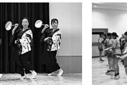
フィナーレ「小須戸甚句」