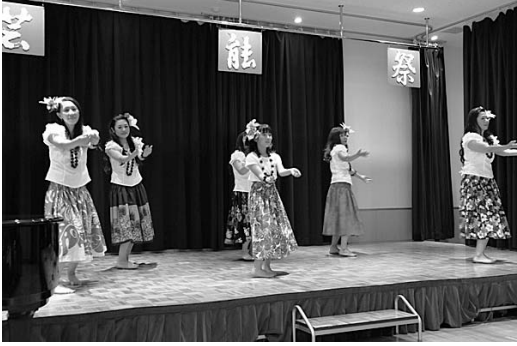
小須戸フラサークルオーキッド

出演された19団体の皆さんが、日頃の練習の成果を十分に発揮されたことから、会場は感動の渦に包まれました。