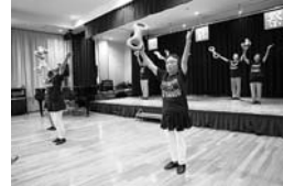
サークルひまわり