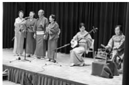
小須戸民謡愛好会