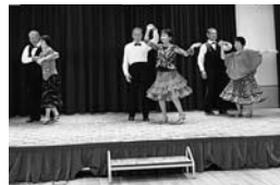
シャルウィダンスこすど