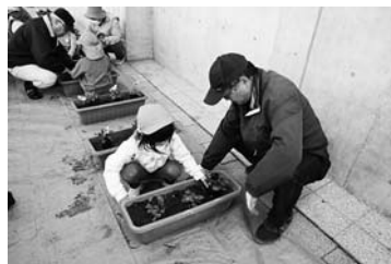
矢代田駅西口での保育園児による植栽作業

当日は、前日から降り続いた雨は止んでいたものの、風が強く肌寒い中、矢代田保育園園児19名、矢代田小学校3年生26名、「花の会」・「花水隊」の皆さん約20名、保育士や小学校の先生も含めると約70名で、パンジーやピオラの花とチューリップの球根をプランターに植える作業を行い、まちの玄関口を明るく色どりしました。