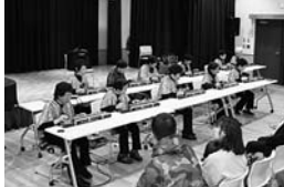
小須戸大正琴愛好会