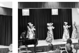
フラサークルピカケ