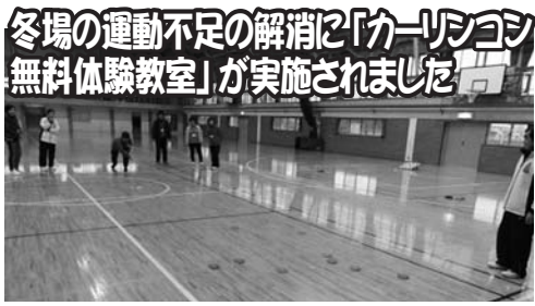
冬場の運動不足の解消に「カーリンコン無料体験教室」が実施されました

1月から2月にかけての毎週水曜日に、小須戸体育館の利用促進及び冬場の運動不足解消を図る目的で、小須戸地区スポーツ振興会及び小須戸体育館の指定管理者の秋葉区スポーツフィールド運営グループの共催で、「カーリンコン無料体験教室」が行われました。 ルールは1チーム3人制の団体戦で、黄色のポイント(的)に自分のチームの色のディスクを何枚近づけられるかで、先に7点に達したチームが勝ちという至ってシンプルな競技です。 単純なルールながらも、ディスクの色が裏返って相手チームのディスクになったり、相手のディスクをはじき飛ばすつもりが、味方のディスクを間違っ飛ばしてしまうなど、予想外の展開に大変盛り上がるおもしろいニュースポーツです。また、カーリンコンには「介護予防」や「健康寿命の延伸」、「自らの健康度を高める」など様々な効果があり、老若男女、障がいのある人もない人も、ともに楽しむことができます。今後の「無料体験教室」の予定については、小須戸武道館 TEL 0250-38-2121 までお問い合わせください。