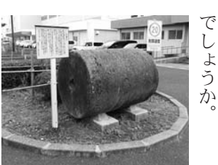
小須戸中学校に移設された「円筒石」(石のローラー)

百年以上も昔から町民による土木作業などで使われて町の弥栄に深く関わっただけでなく、戦後しばらく小・中学校のグラウンドの整地で活躍したローラー石です。節目の年に中学校に帰ってきたことを運命的と受け止めるのは、感傷的すぎるでしょうか。