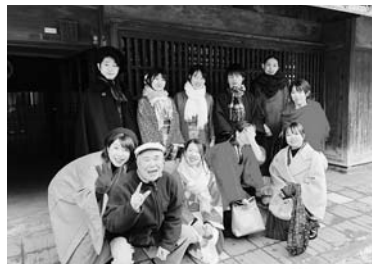
2月9・22・23・24日と4日間にわたって開かれた「着物を着てまち歩き」町屋づくりの伝統的な街並みの中を着物を着てひな飾りの会場を巡る様子が、信濃川の舟運で栄えた在郷町の模様を再現しているようで、多くの写真愛好家が、その様子を撮影していました。