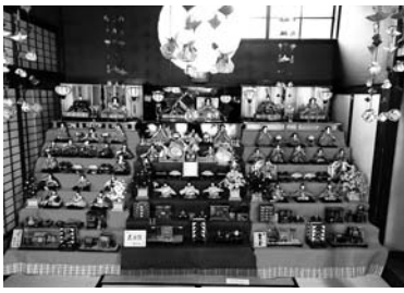
県内各地より寄付された「町屋ギャラリー薩摩屋」で飾られた雛飾り