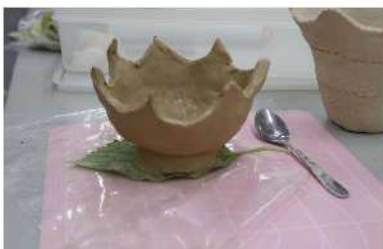
【参加者の作品の一例】オープン陶土を使い、土器を制作しました。

※Wi-Fiなどのインターネット接続環境がない場所では、通信料がかかりますのでご注意ください。