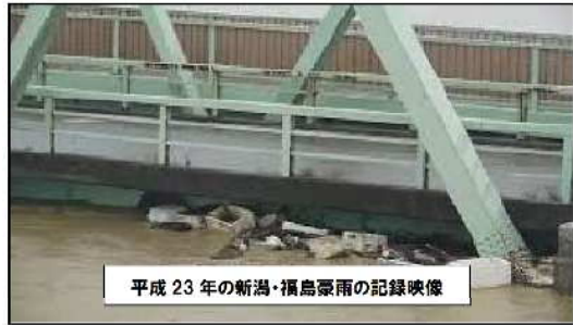
平成23年の新潟・福島豪雨の記録映像

「小須戸親子フェス」をまだ見ていない方は、上記アドレスや2次元バーコードより視聴できます。