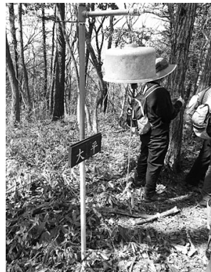
大平に設置してある炊飯釜を加工して作った鐘