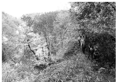
山桜や季節の山野草を眺めながらの楽しい山歩きでした