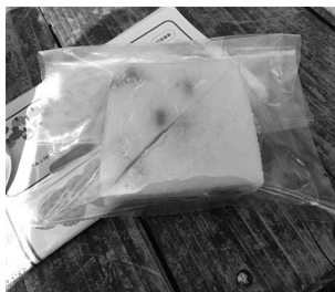
高立山頂で「うららこすど」の豆餅を食べ、英気を養いました