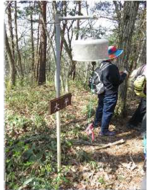
大平に設置してある炊飯釜を加工して作った鐘