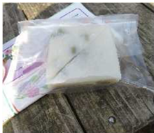
高立山頂で「うららこすど」の豆餅を食べ、英気を養いました