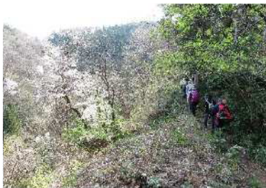
山桜や季節の山野草を眺めながらの楽しい山歩きでした