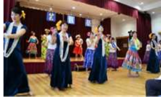
小須戸フラスカールオーケッド、ブルメリア&フラスカールピカ