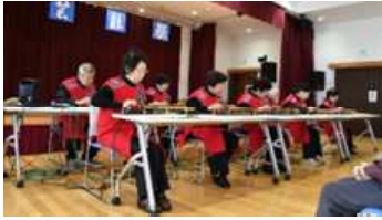
小須戸大正琴愛好会

11月10日(日)、小須戸まちづくりセンターで開催され、13団体の出演があり、大正琴、ピアノ、トロンボーン、クラシックギター、ストリートダンス等様々なジャンルを楽しむことが出来ました。3階ホールを埋め尽くすほどの270名の観客が来場しました。