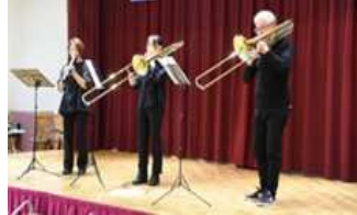
NWE トロンボーンアンサンブル