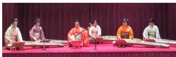
秋の演奏会の様子

雅楽斐会では、体験ができます。楽器に触れて、おしゃべりするだけでも大歓迎です。興味のある方は活動日に直接会場へお越しください。お待ちしております。