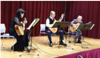
小須戸クラシックギタークラブ