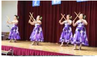
ファイフラ オレイ アロハ