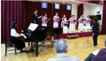
コール・あじさい