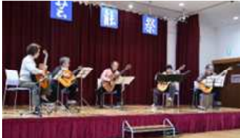
ギタークラブ テクテク