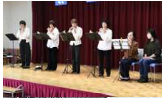
ライリッシュオカリナクラブ