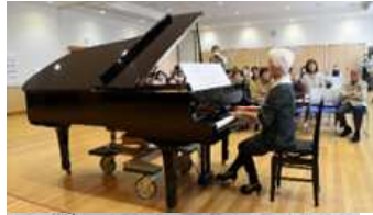
もしもピアノの会